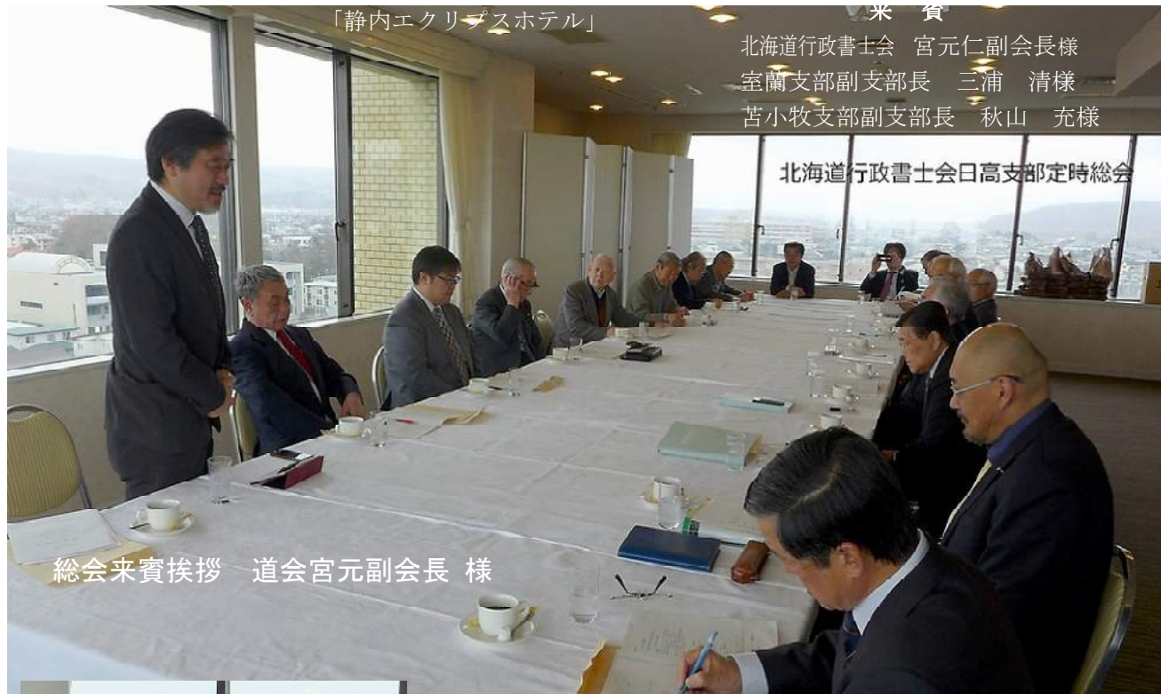
総会来賓挨拶 道会宮元副会長様