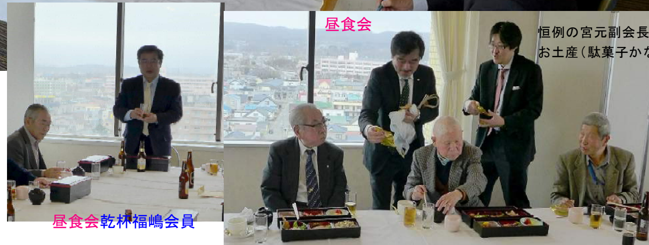
昼食会 乾林福嶋会員

事業報告・決算報告並びに事業計画・予算案については質疑も無く提案通り承認決定された。